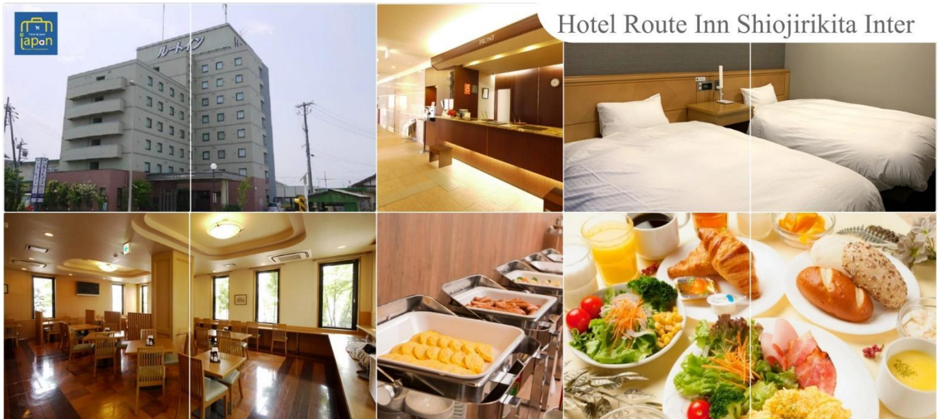
Hotel Route Inn Shiojirikita Inter

HOTEL ROUTE-INN SHIOJIRIKITA INTER, MATSUMOTO หรือเทียบเท่าระดับ